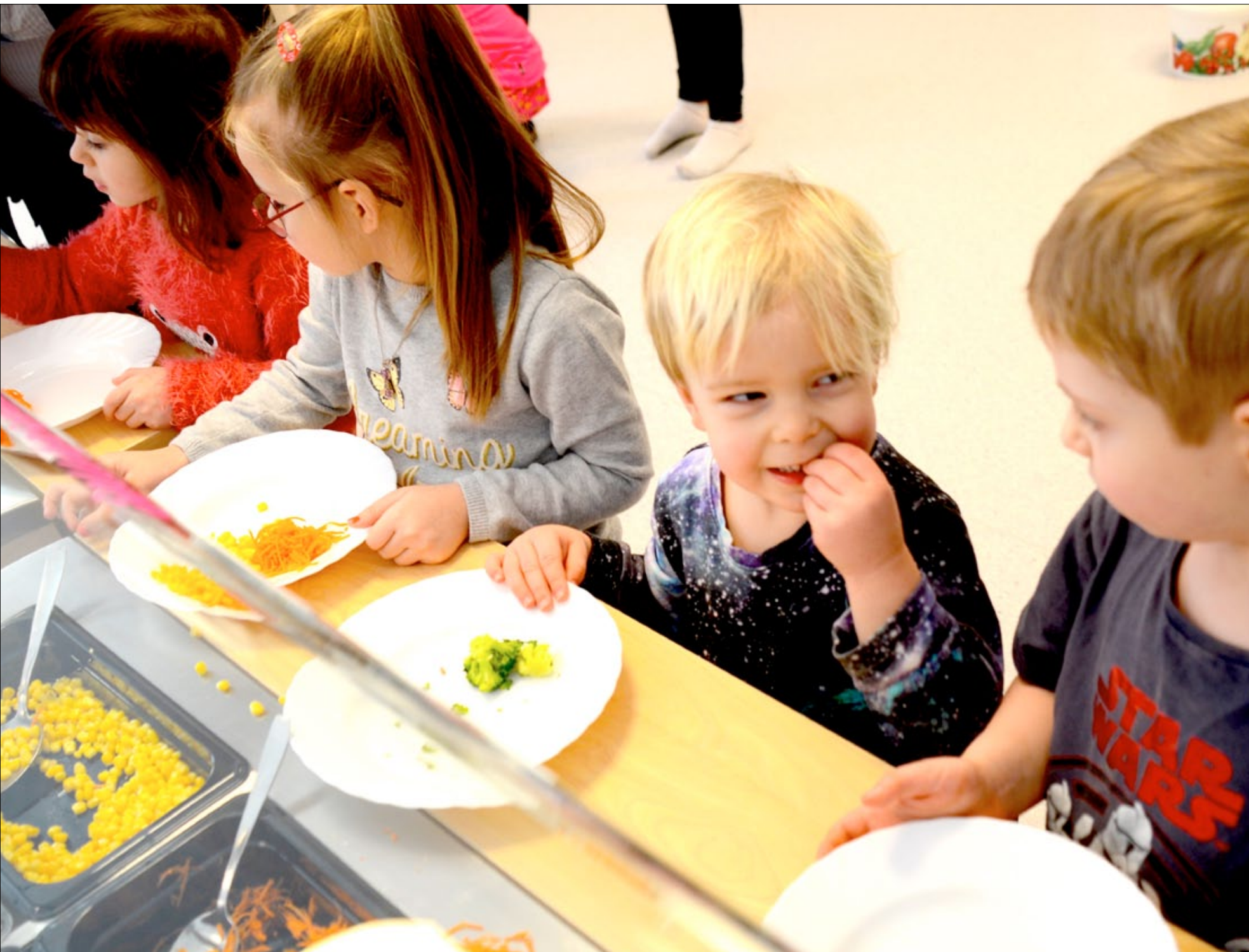
Den nya matsalen med självservering i barnnivå är en av de största nyheterna på den nya förskolan. Den smarta utformningen av avdelningarna är en annan.