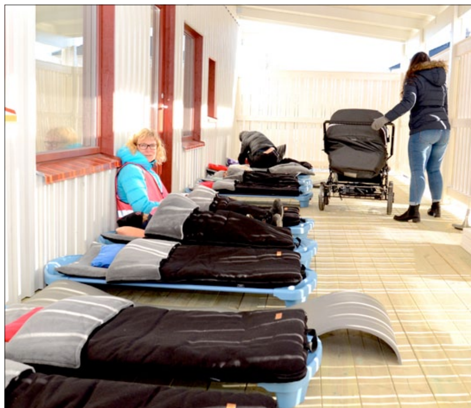
I anslutning till småbarnsavdelningen finns ett soldäck där barn (och personal?) kan ta sig en tupplur. På vintern bäddas de ner i en sovpåse.