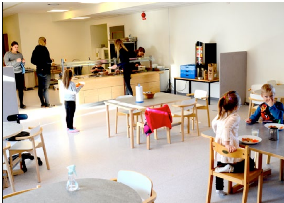
Den lilla, lilla matsalen där såväl bord som serveringsdisk är i barnens nivå.