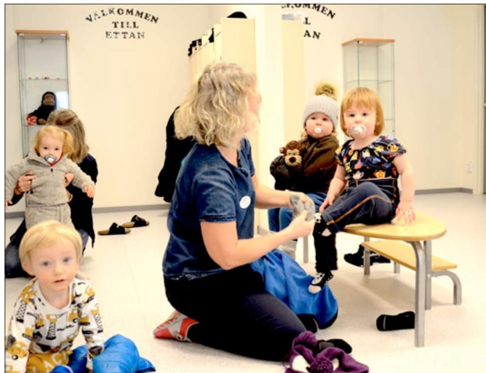
Gott om plats för att klä på de små barnen.